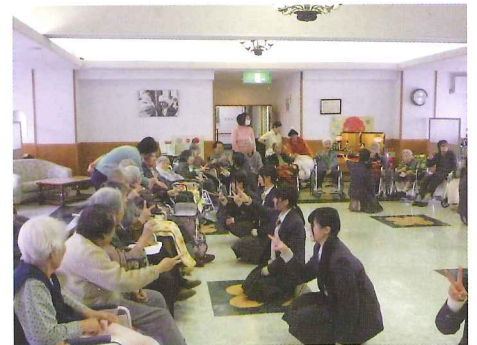
高校生との交流会