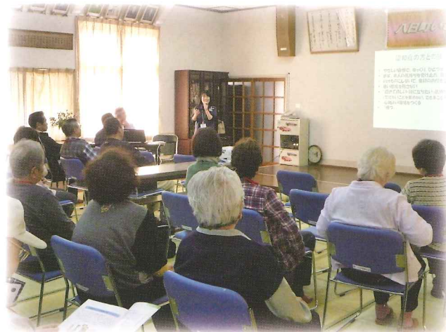
認知症サポーター講座

在宅介護に関する総合的な相談に応じます。また、地域の方を対象に介護予防教室を開催しています。